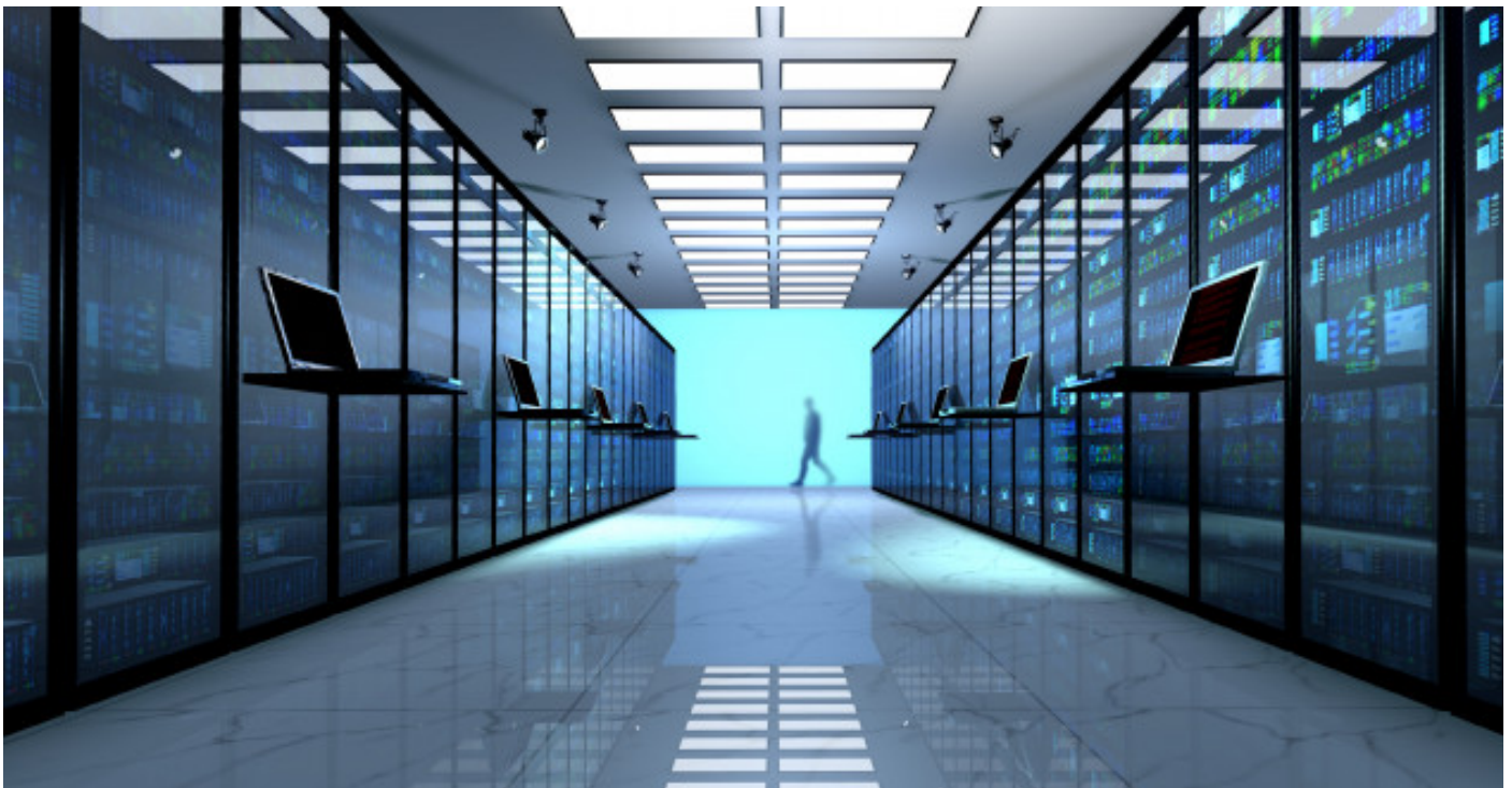
( https://securityintelligence.com/continuous-compliance-eases-cloud-adoption-for-financial-services-firms/ )